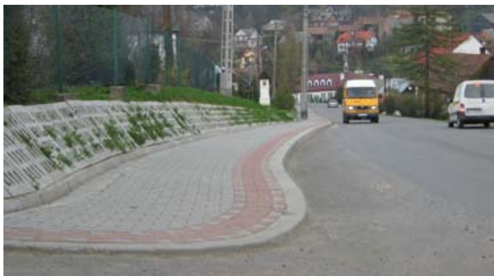
Przebudowana droga powiatowa Grybów - Krużłowa Niżna.