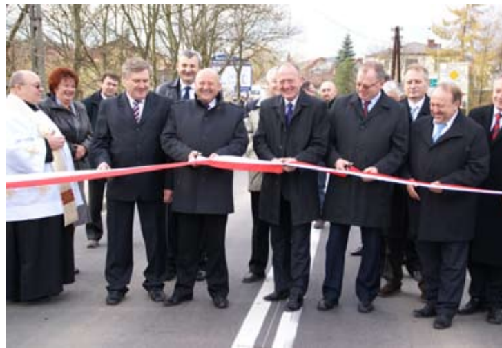
Otwarcie drogi Łososina Dolna - Ujanowice - Młynne.

Ponad 10 milionów złotych kosztowała przebudowa drogi powiatowej Łososina Dolna – Ujanowice – Młynne (na terenie powiatu nowosądeckiego). Wczoraj uroczystość oddano ją do użytku.