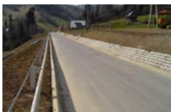
Zabezpieczenie osuwiska w Obidzy. Koszt: 1.621.735 zł