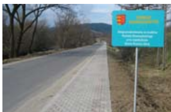
Przebudowa drogi Krynica - Tylicz i Powroźnik - Tylicz. Koszt: 4.400.000 zł