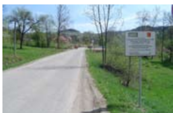
Remont i przebudowa drogi Nawojowa - Żeleźnikowa Wielka - Łązy Biegonickie. Koszt: 10.678.507 zł