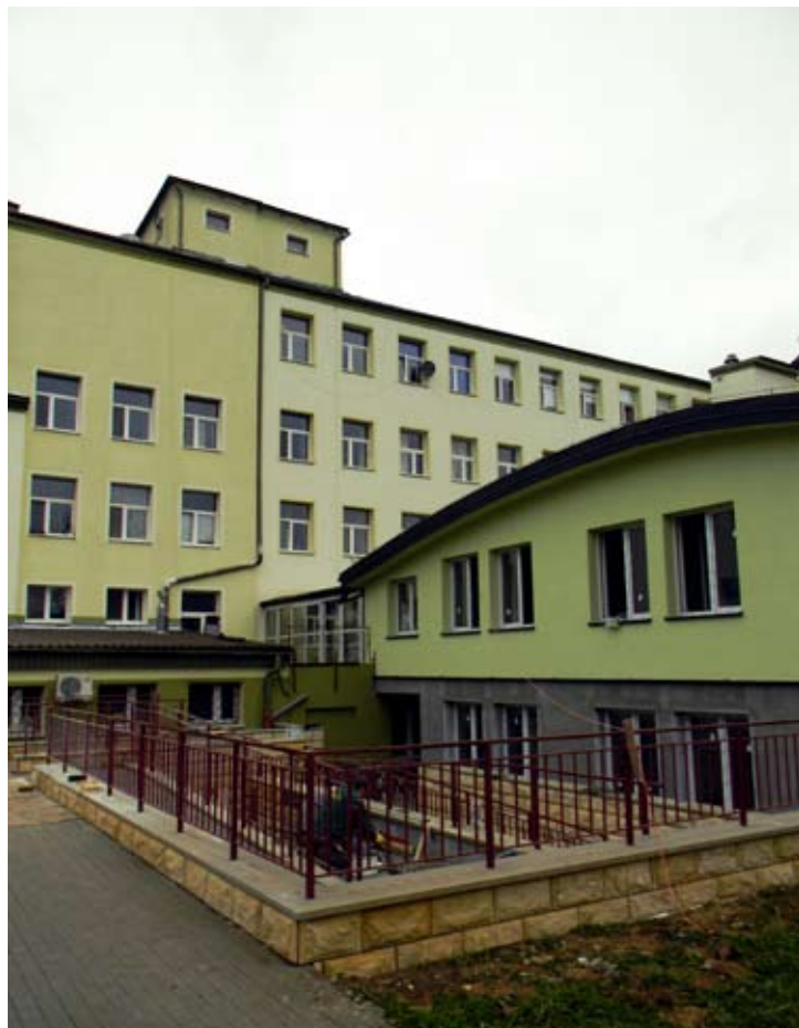
Modernizacja budynku Szpitala w Krynicy-Zdroju.

Po remoncie w salach będą po cztery łóżka a nie jak teraz, po sześć czy siedem. Więcej będzie też łazienek i sanitariatów oraz przestrzeni w salach i na korytarzach. Szpital będzie wyglądał lepiej pod względem estetyki – na ścianach pojawią się żywe kolory, co sprawi, że sale nabiorą blasku. Remont rozpoczął się w czerwcu 2009 r. i zgodnie z projektem ma zostać zakończony w maju 2011 r. Jednak dyrektor Alicja Jarosińska zapewnia, że prace zostaną sfinalizowane już w lutym przyszłego roku. Prowadzona modernizacja sprawi, że szpital będzie spełniał wymogi sanitarno-epidemiologiczne zapisane w ustawie Ministra Zdrowia