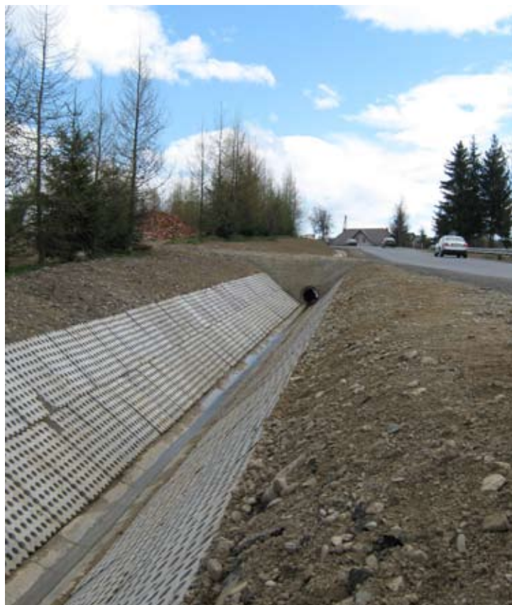
Zabezpieczenie osuwiska w Librantowej.