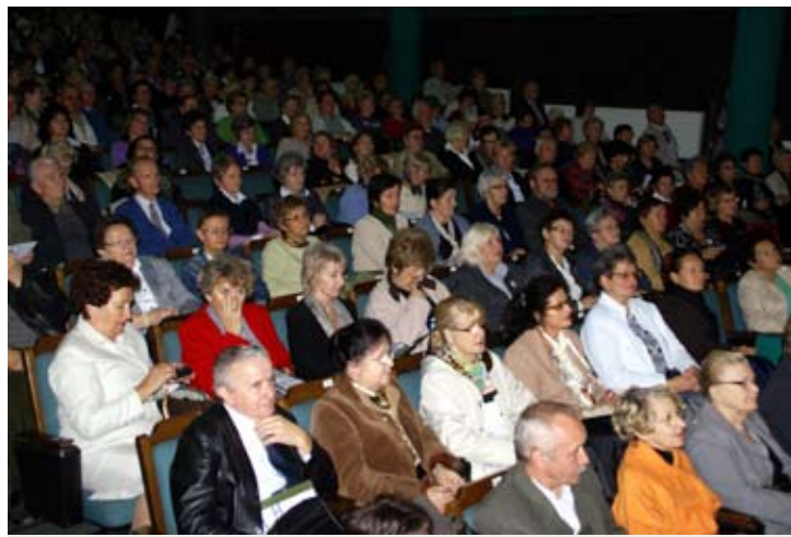
Inauguracja roku akademickiego w SUTW.

Wykłady specjalistyczne odbywają się w czterech sekcjach: kulturoznawczej, medycznej i profilaktyki zdrowia, geograficzno-przyrodniczej oraz społeczno-ekonomicznej. Każda wybiera swój samorząd - starostę, wicestarostę, członka sądu koleżeńkiego i radę programową, którzy są jednocześnie delegatami na Walne Zebranie Stowarzyszenia. Słuchacze biorą także udział w zajęciach rekreacyjno-ruchowych, wyjazdach turystycznych, wycieczkach pieszych i spotkaniach integracyjnych. ■