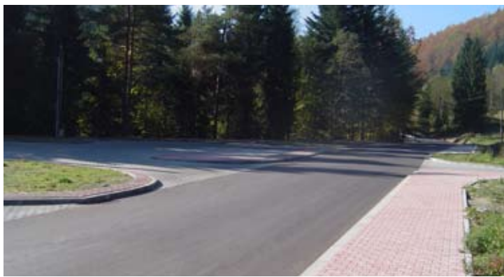
Przebudowana droga powiatowa Rytró - Róztoka Wielka.

Sporo kosztowała też modernizacja drogi Nawojowa – Żeleznikowa Wielka – Łazy Biegonickie. Na drugi etap przebudowy wydano 4.413.593 zł, w tym dofinansowanie z Narodowego Programu Przebudowy Dróg Lokalnych wyniosło 2.206.790 zł. W ramach projektu położono nową nawierzchnię na długości blisko 2 km i przebudowano chodniki. Powstała zatoka autobusowa, przebudowano siedem przepustów i wyremontowano kilka zjazdów. Dodatkowo, przy drodze pojawiły się bariery energochłonne i oznakowane przejścia dla pieszych.