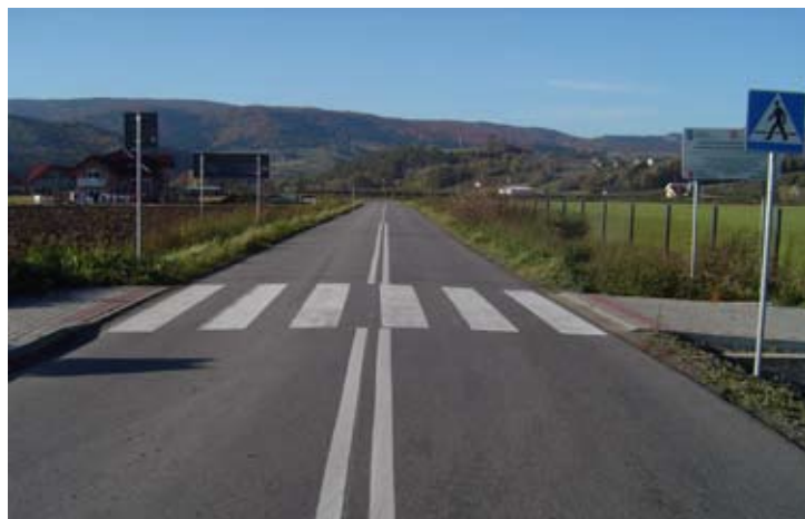
Droga Łososina Dolna - Ujanowice - Młynne po remoncie.