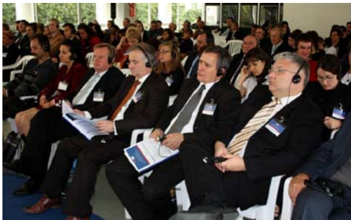
V Międzynarodowa Konferencja „Transgraniczna turystyka ekologiczna jako szansa rozwoju Sądeckczyzny” w Massa (Włochy).