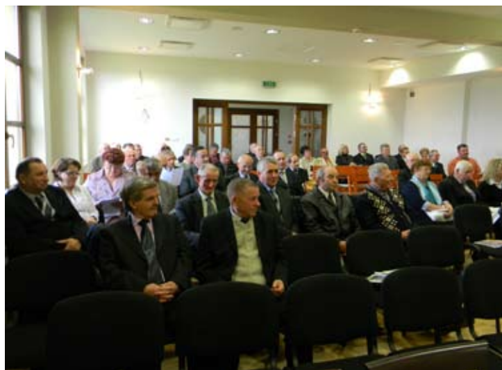
Spotkanie z sołtysami w Starym Sączu.

przedsiębiorcy, sołtysi i inni lokalni liderzy. W ostatnim czasie takie spotkania odbyły się m.in. w Starym Sączu, Łososinie Dolnej i Piwnicznej. Po zakończeniu cyklu konsultacji powstanie projekt nowej strategii, który będzie „obrabiany” w ramach kolejnych prac samorządu. W efekcie ma powstać dokument, który wyznaczy cele i drogi rozwojowe Sądeckiego na najbliższe dziesięciolecie. Będzie on m.in. podstawą do wnioskowania o unijne dotacje na konkretne przedsięwzięcia rozwijające poszczególne sfery życia Sądeczan. ■