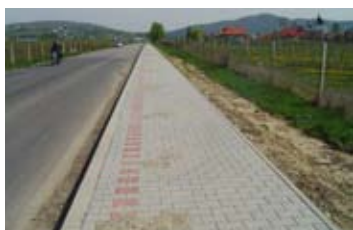
Przebudowa drogi Młynne - Łososina Dolna - Ujanowice. Koszt: 13.656.713 zł