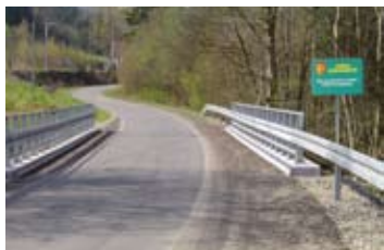
Remont mostu w Gaboniu. Koszt: 254.300 zł