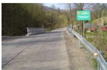
Remont mostu w Brzynie. Koszt: 225.482 zł