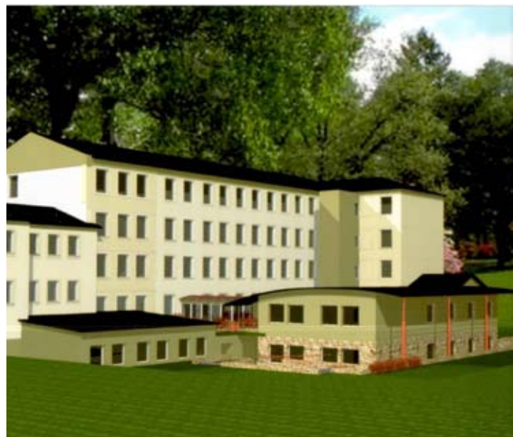
Komputerowa wizualizacja Szpitala w Krynicy-Zdroju.

35 – tylu lekarzy pracuje w krynickim szpitalu 55 – tyle lat ma krynicki szpital 155 – tyle pielęgniarek tutaj pracuje 180 – tyle jest łóżek 700 – tyle porodów odbiera się rocznie 14 500 – tylu pacjentów jest rocznie