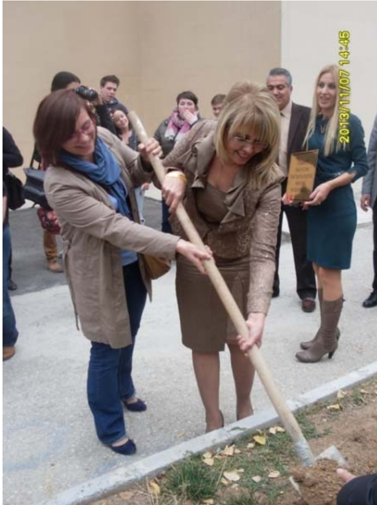
Sadzenie drzewek i instalowanie tablicy pamiątkowej projektu