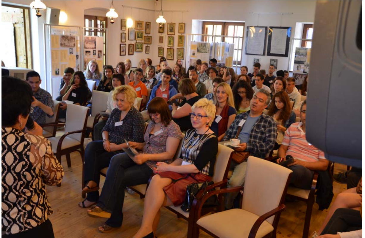
Powitanie w Muzeum Regionalnym Państwa Muszyńskiego