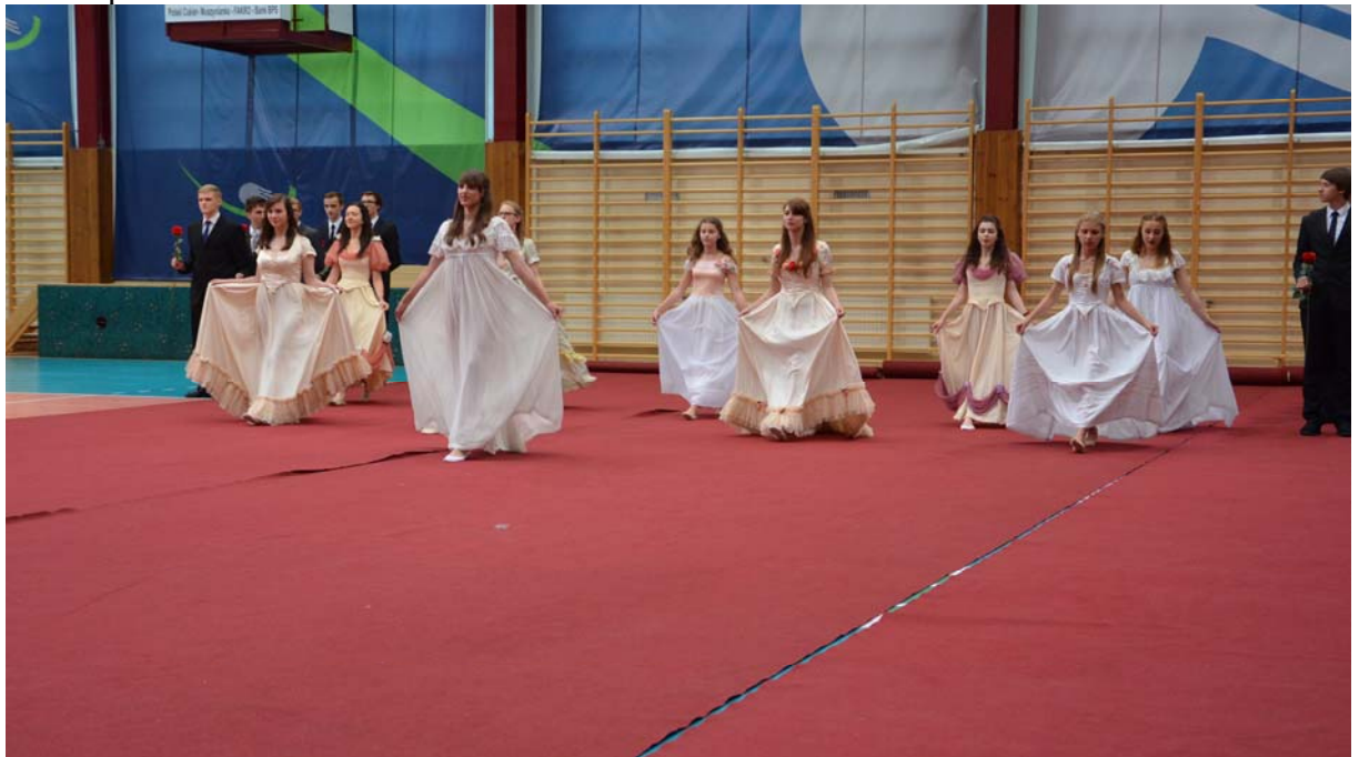
Polonez na zakończenie spotkania