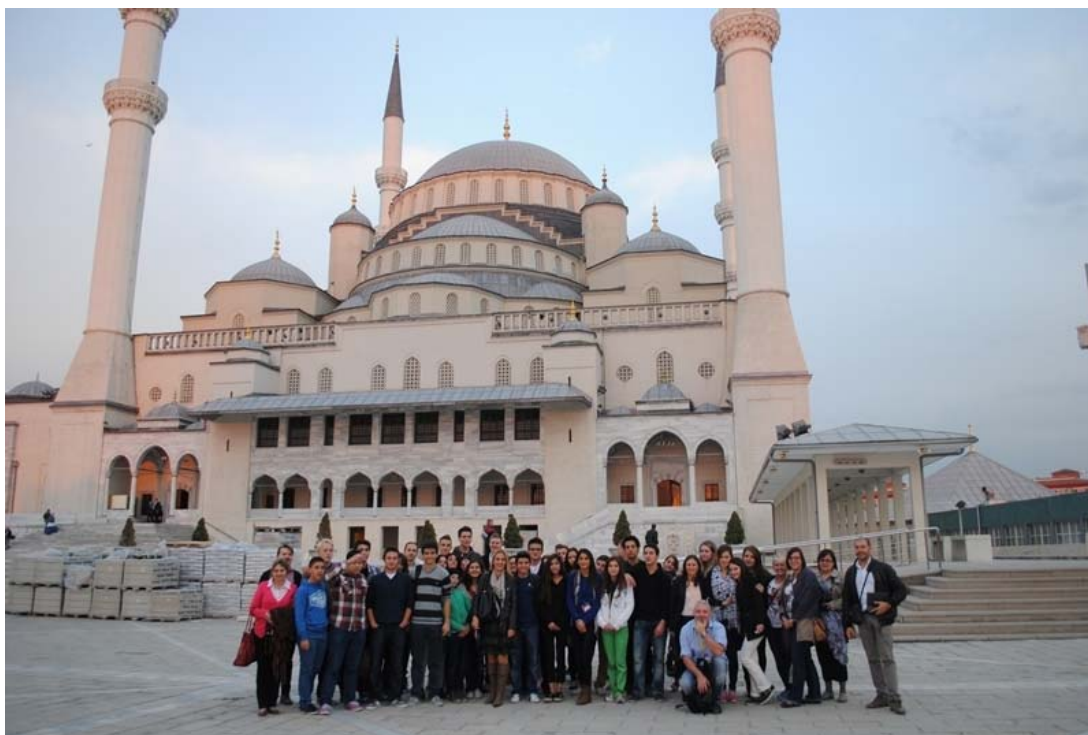
Zdjęcie grupowe pod największym meczetem w Ankarze