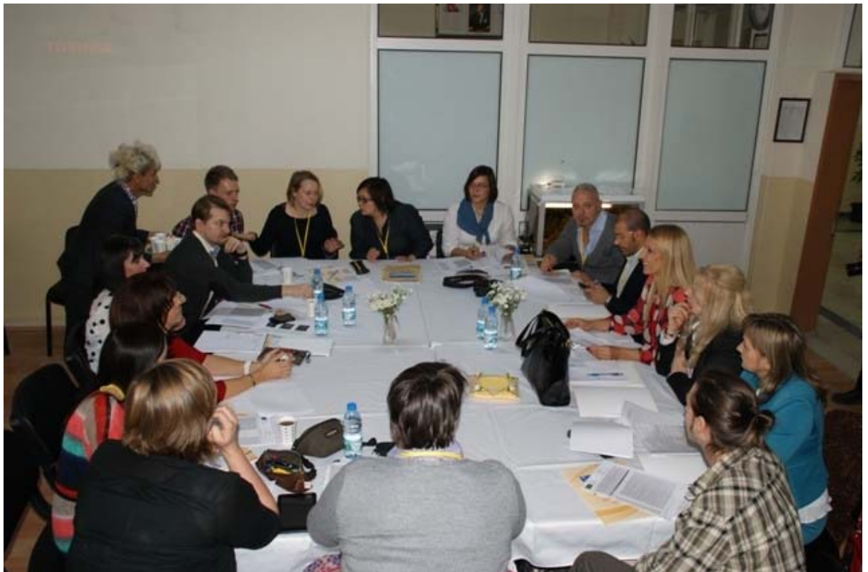
Zajęcia warsztatowe nauczycieli