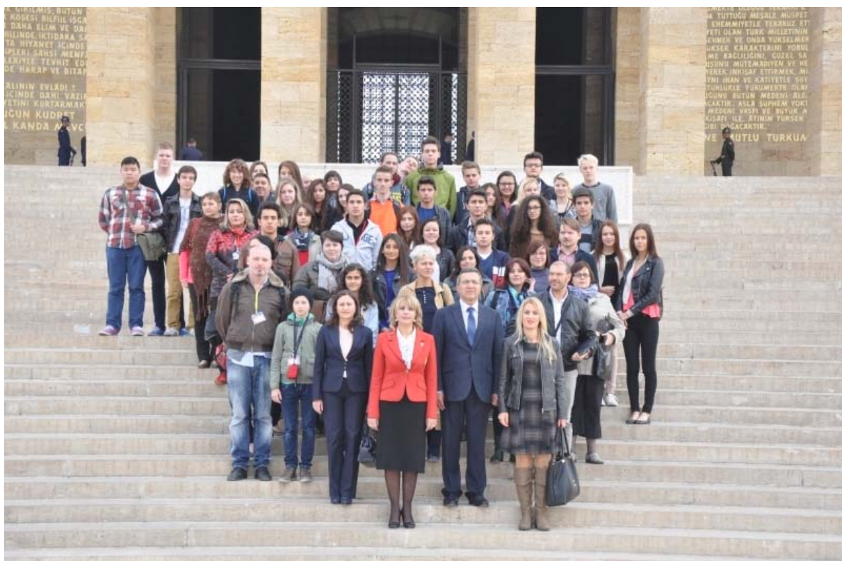
Grupa Comenius pod mauzoleum Ataturka