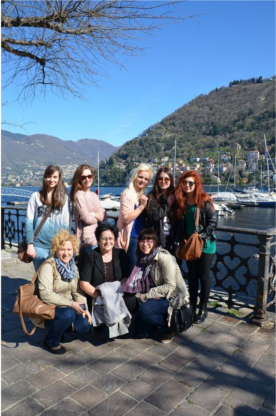
Uczestnicy nad jeziorem Como