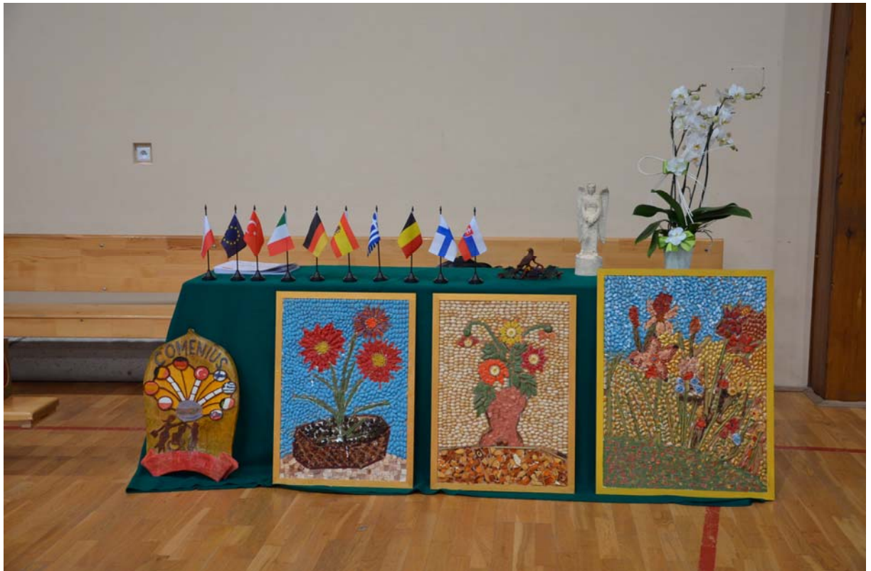
Dziela powstałe w czasie warsztatów